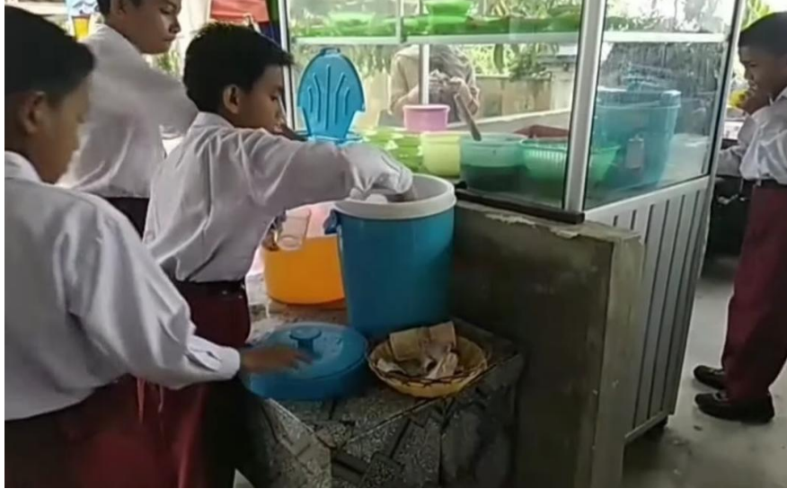
Gambar 6. Kantin Jujur