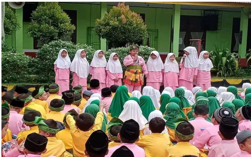
Gambar 5. Kegiatan Muhadharah

Ketiga, muhadharah adalah kegiatan yang diadakan setiap jumat pagi yang memiliki penanggungjawab setiap minggunya misalnya jumat minggu ini penanggungjawabnya kelas 1 hal terus dilakukan secara bergantian. Kegiatan yang didalamnya adalah membaca yasin bersama, ada tausiah singkat dari siswa, perwakilan siswa membacakan surah pendek dan shalawat, terdapat kuis tentang keagamaan. Kemudian karakter yang diharapkan terbentuk yaitu religius, disiplin, kerjasama, dan bertanggungjawab. Hambatannya adalah siswa malu ditunjuk sebagai perwakilan kelas atau mengajukan diri disebabkan kurang rasa percaya diri. Kegiatan Muhadharah dapat dilihat pada Gambar 5.