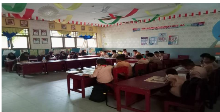
Gambar 2. Kegiatan Membaca 15 Menit Sebelum Memulai Pembelajaran

Hasil penelitian tersebut sejalan dengan pendapat Sari et al., (2021) yang mengungkapkan bahwa budaya literasi ini selain menumbuhkan karakter gemar membaca, karakter lain yang muncul disiplin dalam membaca buku dan merawat buku agar tidak rusak. Kemudian menurut (Oktarina, 2018) Program literasi ini meningkatkan karakter siswa yang gemar membaca, dibuktikan dengan kesadaran mereka pada waktu istirahat dan waktu luang, pemanfaatan sudut baca atau perpustakaan, serta banyaknya pengunjung perpustakaan dan buku yang dipinjam secara rutin. Selain itu, dengan program pendidikan ini siswa akan memperoleh data dan pengalaman yang diperoleh dengan menggunakan. Hambatannya kadang masih ada siswa yang suka lupa untuk membawa buku dan biasanya yang begitu siswa yang kurang motivasi membacanya karena di rumah tidak dibiasakan. Hambatan ini juga ditemukan pada penelitian (Dharma, 2020) yaitu siswa tidak mengikuti intruksi dari guru untuk membawa buku dari rumah dan siswa masih ada yang bermain ketika membaca sehingga tidak fokus untuk membaca. Hal ini dapat dilihat pada Gambar 2.