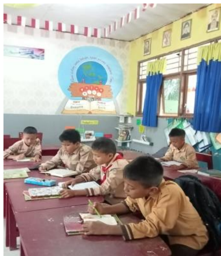
Gambar 3. Kegiatan Membaca Alquran

Kegiatan awal dan akhir KMB ini ada beberapa kegiatan yang dilakukan yaitu kegiatan membaca Al-Quran, rabu bersih, muhadharah, dan rabu bersih. Pertama. kegiatan membaca Alquran ini diadakan rutin dan bergantian dengan kegiatan membaca buku selama 15 menit sebelum memulai pembelajaran. Hal ini bertujuan untuk melihat kemampuan siswa dalam mengaji. Kegiatan membaca Alquran ini dilakukan seperti membaca ayat pendek, kemudian ada yang membaca Alquran per juz di kelasnya. Hambatannya adalah masih ada siswa yang belum mampu membacanya terutama siswa yang di kelas tinggi dan ada yang belum menghafal surah-surah pendek. Hal ini dapat dilihat pada Gambar 3.