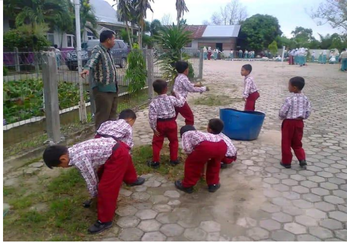
Gambar 4. Kegiatan Rabu Bersih

Ketiga, muhadharah adalah kegiatan yang diadakan setiap jumat pagi yang memiliki penanggungjawab setiap minggunya misalnya jumat minggu ini penanggungjawabnya kelas 1 hal terus dilakukan secara bergantian. Kegiatan yang didalamnya adalah membaca yasin bersama, ada tausiah singkat dari siswa, perwakilan siswa membacakan surah pendek dan shalawat, terdapat kuis tentang keagamaan. Kemudian karakter yang diharapkan terbentuk yaitu religius, disiplin, kerjasama, dan bertanggungjawab. Hambatannya adalah siswa malu ditunjuk sebagai perwakilan kelas atau mengajukan diri disebabkan kurang rasa percaya diri. Kegiatan Muhadharah dapat dilihat pada Gambar 5.