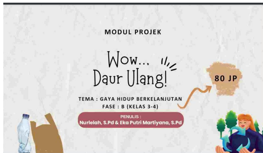
Gambar 1. Profil Modul Proyek

Sedangkan deskripsi proyek berisikan secara garis besar, kegiatan ini dibagi menjadi empat bagian: 1. Temukan, 2. Bayangkan, 3. Lakukan, dan 4. Bagikan. Pada kegiatan temukan, anak-anak akan diajak untuk memahami tentang lingkungan. Hal ini dilakukan untuk memberikan pemahaman awal sebelum memulai proyek. Kemudian anak-anak di ajak untuk mengetahui pengelolaan sampah dengan cara daur ulang. Pada kegiatan bayangkan, anak-anak akan diajak fokus mengenal produk daur ulang yang ada di lingkungan sekitar. Kemudian pada kegiatan lakukan, anak-anak diajak untuk berdiskusi mencari ide produk daur ulang yang akan dibuat. Kemudian setiap kelompok mempresentasikan hasil diskusinya agar guru dan teman bisa memberi masukan. Ide hasil diskusi ini dipraktikkan secara berkelompok. Kegiatan terakhir adalah bagikan, anak-anak akan menggelar pameran karya hasil dari kegiatan daur ulang yang telah dibuat oleh masing-masing kelompok. Tujuan dan deskripsi proyek dapat dilihat pada Gambar 2.