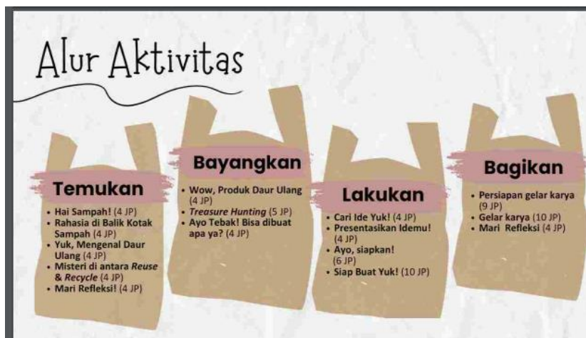
Gambar 3. Alur Aktivitas

Selanjutnya setelah semua aktivitas dilakukan dalam modul ajar ini terdapat penilaian atau assesmen . Terdapat beberapa penilaian yang dilakukan yaitu penilaian sumatif, penilaian formatif, refleksi siswa, dan lembar evaluasi.