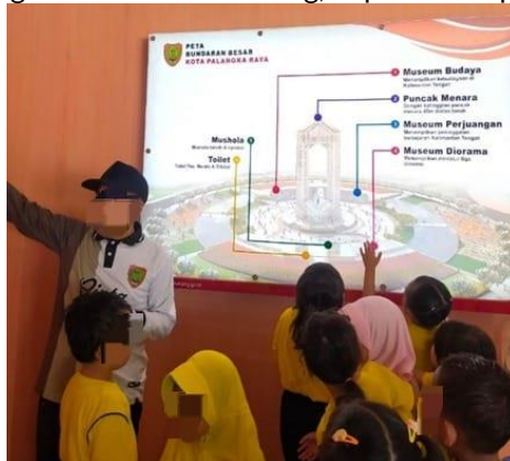
Gambar 5. Anak Memperhatikan Peta Bundaran Besar Talawang Sebelum Turun Langsung Kelapangan

Selanjutnya pada pelaksanaannya terdapat pembelajaran di luar kelas yaitu berkunjung di bundaran besar kota Palangka Raya yang disebut dengan Bundaran Talawang, dapat dilihat pada Gambar 5.