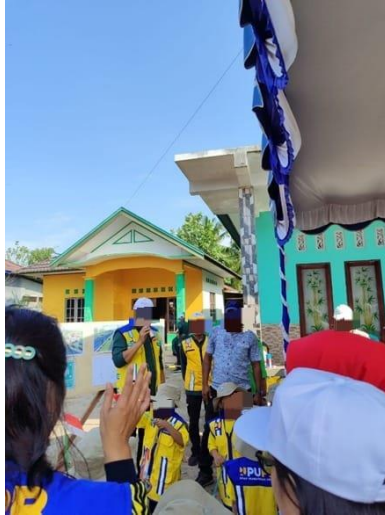
Gambar 3. Kegiatan Inti Anak Memperhatikan Penjelasan Langsung Oleh Bidang Kontruksi Mengenai Alat Berat

Berdasarkan data di atas maka pelaksanaan implementasi kurikulum merdeka pada pengembangan pembelajaran ke PUPR-AN dapat dilihat pada Gambar 3.