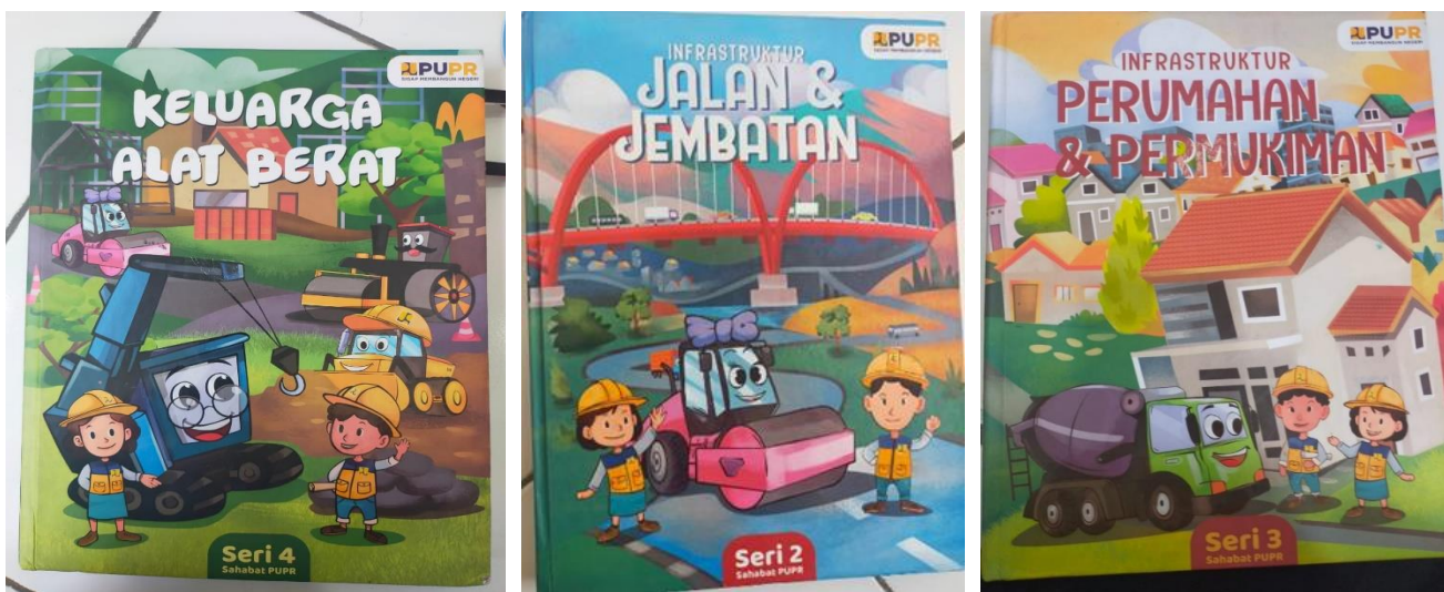
Gambar 2. Contoh Materi Dalam Pengembangan Materi ke PUPR-AN pada PAUD

Guru mengungkapkan sebagaimana berikut ini.