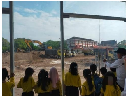
Gambar 4. Anak Turun Kelapangan Melihat Secara Langsung Alat Berat

Selanjutnya pada pelaksanaannya terdapat pembelajaran di luar kelas yaitu berkunjung di bundaran besar kota Palangka Raya yang disebut dengan Bundaran Talawang, dapat dilihat pada Gambar 5.