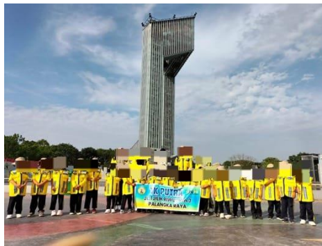
Gambar 6. Foto Bersama di Bundaran Besar Talawang Kota Palangka Raya

Berdasarkan hal tersebut, pelaksanaan pembelajaran harus memperhatikan capaian pembelajaran yang sesuai dengan perkembangan anak yaitu dengan menciptakan lingkungan belajar menarik, jika kita lihat dari tema pekerjaan subtema konstruksi pada pembelajaran materi ke PUPR-AN maka anak di ajak ketempat-tempat sesuai dengan tema tersebut, yaitu dengan mengunjungi bundaran besar Palangka Raya yang dinamai Bundaran Talawang. Anak memperhatikan sekeliling bundaran dan menyimak penjelasan seseorang yang bekerja pada bidang konstruksi tersebut, seperti apa sejarah berdirinya Bundaran Talawang, apa saja yang ada di bundaran, dan apa arti dari Talawang. Dari kegiatan tersebut anak mendapatkan pengetahuan yang lebih dengan pembelajaran yang menarik, selain itu juga anak akan mengetahui apa itu Bundaran Talawang dan apa itu Talawang dalam bahasa dayak, secara tidak langsung anak akan mengetahui sejarah budaya yang ada didaerahnya.