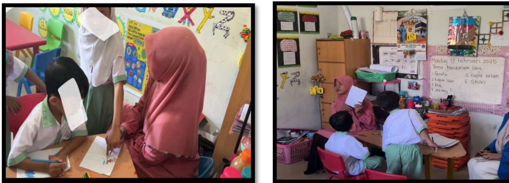
Gambar 3. Kegiatan Intruksi gambar sesuai tema

"Instruksi sangat penting dalam kegiatan menggambar agar anak-anak memahami apa yang harus mereka lakukan. Biasanya, saya memberikan instruksi secara bertahap dan dengan bahasa yang sederhana agar mudah dipahami oleh anak-anak. Untuk membantu mereka mengikuti instruksi dengan lebih baik, saya juga sering menggunakan contoh visual langsung pada anak." (ANT).