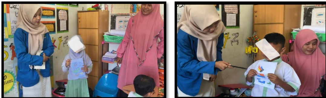
Gambar 4. Menceritakan Cerita yang Digambar Anak dan Hasil Karya Anak

"Dengan adanya memprestasikan Hasil karya anak dalam program literasi "Buku Cerita Istimewa", akan memberi kesempatan kepada anak-anak untuk menjadi lebih percaya diri saat menunjukkan hasil pekerjaan mereka. Mereka menemukan cara untuk menjelaskan apa yang gambar mereka buat, menjelaskan prosesnya, dan menjelaskan perasaan mereka saat membuatnya"(ANT).