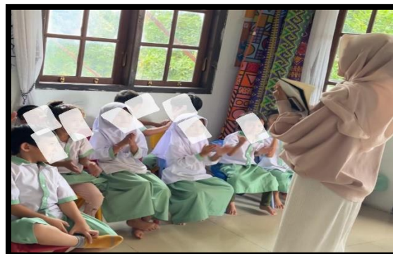
Gambar 6. Melakukan Recalling atau Tanya Jawab

"ya pertama saya memberitahu anak-anak jika kegiatan sudah selesai, saya akan melakukan recalling dengan menanyakan kepada anak kegiatan apa saja yang sudah dilakukan kepada masing-masing anak, dan guru akan membagikan hasil gambar mereka yang mana anak akan mempresentasikan kedepan hasil gambar yang telah mereka buat dengan tema "Kendaraan Laut". (ANT).