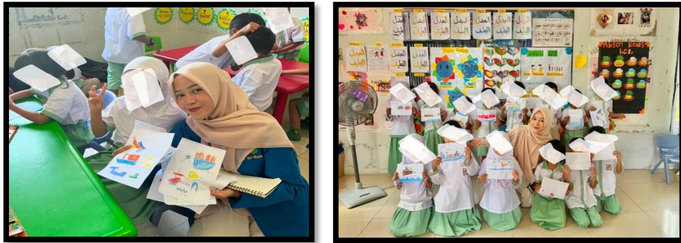
Gambar 5. Pengumpulan Hasil Gambar Anak

" pada pengumpulan hasil gambar anak-anak akan merasa senang dan bangga. Mereka biasanya dengan senang hati menunjukkan karya mereka kepada teman-temannya. Ini meningkatkan rasa percaya diri mereka juga". (ANT).