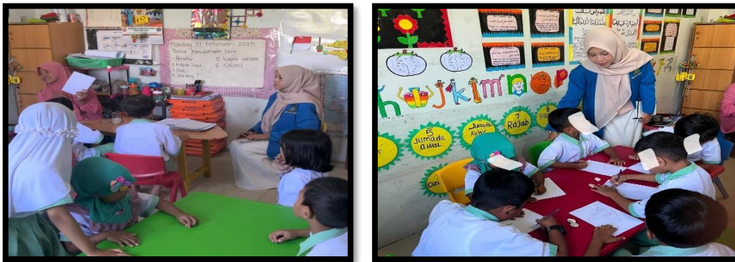
Gambar 2. Kegiatan pelaksanaan pembagian alat kegiatan "Buku Cerita Istimewa"

Gambar 2 menunjukkan bahwa guru memperlihatkan contoh gambar sesuai tema "Kendaraan Laut". Hal ini dilaksanakan untuk mengajarkan anak bagaimana mengenal pembelajaran mengenalkan berbagai alat kendaraan Laut. Pada kegiatan inti, guru menjelaskan alat yang harus disiapkan untuk di ambil saat menggambar dengan tema "Kendaraan Laut". Proses belajar anak akan mudah memperlihatkan dalam media dan gambar belajar konkret sebagai perantara untuk menyampaikan pesan melalui pembelajaran yang diberikan oleh guru (Ilmiah et al., 2024). Melalui berbagai aktivitas bermain dan belajar pada Tema kegiatan bertujuan untuk mendorong kreativitas dan imajinasi anak serta menanamkan nilai kepedulian terhadap lingkungan, terutama dalam menjaga kebersihan laut. anak-anak dapat belajar sambil bermain dengan cara yang menyenangkan, membuatnya lebih mudah untuk memahami dan mengingat apa yang diajarkan (Wahyuni, 2022). Hal ini menjadi bukti ketercapainya anak pada kegiatan literasi dalam kemampuan pembuatan buku dari hasil gambar anak yang menjadi sebuah karya. Selanjutnya, Ibu ANT juga menjelaskan tahapan pelaksanaan ini.