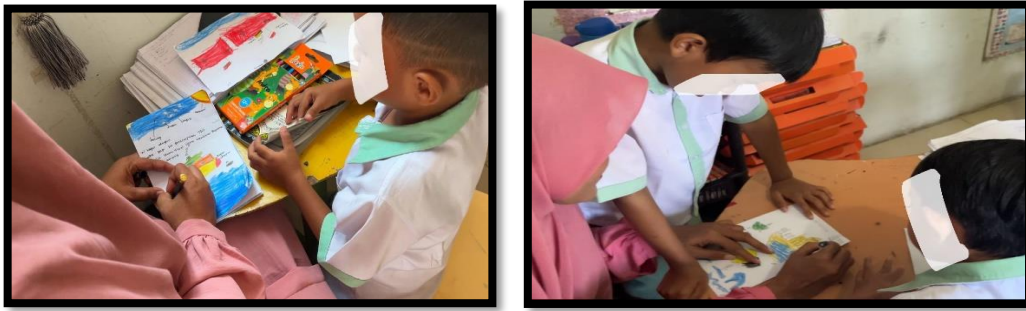
Gambar 4. Kegiatan penulisan cerita dari hasil gambar

"Dalam proses kegiatan biasanya saya melakukan tanya jawab dan meminta anak untuk diperlihatkan hasil gambar yang sudah dibuat, untuk ketahap penulisan cerita dimana anak akan menunjuk setiap gambar yang memiliki makna cerita pada gambar menjadi hasil karya Buku Cerita Istimewa." (ANT).