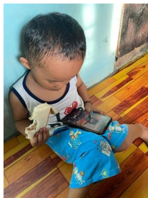
Gambar 4. Ketika Ananda I Asik Bermain HP Sambil Makan

Tidak hanya dampak positif yang anak dapat dari penggunaan gadget, tetapi orang tua mengeluh juga terhadap dampak negatif yang muncul ketika anak bermain gadget. Seperti makan harus sambil bermain HP, ketika tidak diberi HP akan nangis, terika, berhambur isi rumah, tidak suka bermain di luar tunggu dipaksa oleh orang tua terlebih dahulu baru mau bermain di luar rumah.