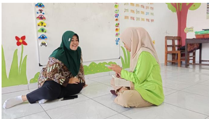
Gambar 1. Wawancara dengan Guru

Keterlambatan berbicara pada anak tidak hanya adanya gangguan pada perkembangan bahasa anak, tetapi dapat menyebabkan munculnya gangguan perkembangan anak dari aspek lainnya. Seperti contoh pada perkembangan sosial emosional, anak yang memiliki keterlambatan berbicara cenderung akan menarik dari teman sebaya nya karena merasa kesulitan saat berinteraksi dengan temannya. Hal tersebut dapat berpengaruh pada proses belajar anak di sekolah. Begitu pula yang ditemukan pada sekolah, salah satu murid pada sekolah tersebut kedapatan memiliki permasalahan pada gangguan keterlambatan berbicara. Jenis dari gangguan keterlambatan berbicara pada salah anak tersebut adalah Developmental Language Disorder (DLD) . Jenis gangguan Developmental Language Disorder (DLD) adalah gangguan perkembangan bahasa pada anak, dapat dilihat dari anak kesulitan dalam memahami(bahasa reseptif) atau menggunakan bahasa (bahasa ekspresif) tanpa penyebab medis atau neurologis yang jelas dan tercatat(Bishop et al., 2017).