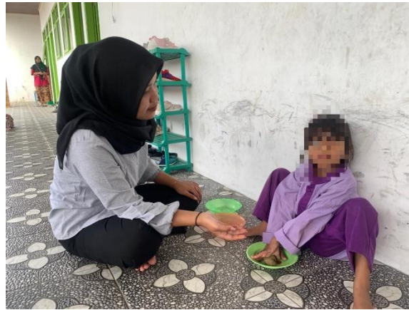
Gambar 2. Pendekatan Terhadap Anak Speech Delay

Dari pernyataan guru wali kelas, pembelajaran yang diberikan guru kepada anak dengan gangguan keterlambatan berbicara tersebut dengan memberikan pembelajaran khusus. Pembelajaran khusus yang dimaksud adalah pembelajaran yang dimana anak diberikan perhatian lebih pada saat jam pembelajaran dimulai, atau pada jadwal tertentu anak diberikan permainan untuk melatih fokus dan menstimulasi kemampuan berbicaranya pada ruangan tersendiri.