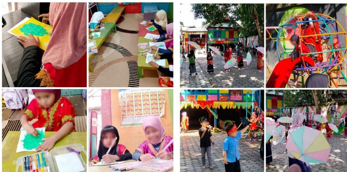
Gambar 2. Metode Pembelajaran Mbojo Juma'a