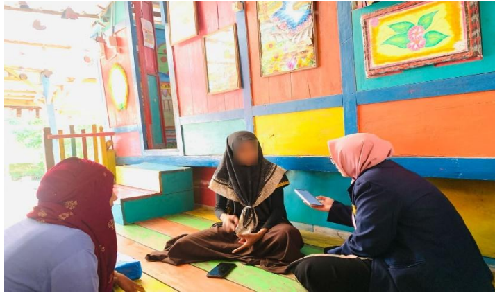
Gambar 3. Wawancara Guru Terkait Perkembangan Kreativitas Anak