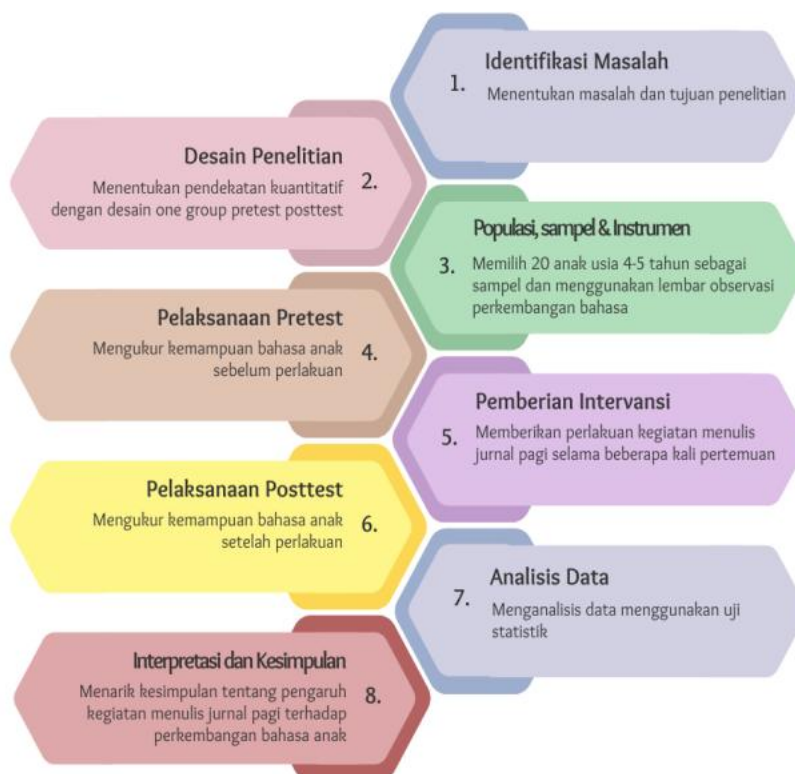
Gambar 1. Alur Penelitian

Data hasil pretest dan posttest perkembangan bahasa anak dianalisis dengan menggunakan bantuan SPSS meliputi analisis statistik deskriptif, uji normalitas, serta uji statistik menggunakan uji t (paired sample t-test) untuk mengetahui perbedaan yang signifikan sebelum dan sesudah perlakuan (Fitri, 2022). Selain itu, dilakukan juga uji n gain untuk melihat peningkatan kemampuan bahasa sesudah kegiatan menulis jurnal pagi (Fitriyani et al., 2025). Uji normalitas diperlukan untuk menentukan apakah data yang dianalisis berdistribusi normal atau tidak, sehingga peneliti dapat memilih pendekatan yang tepat dalam analisis data.