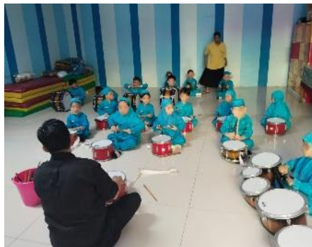
Gambar 2. Proses Pelaksanaan Latihan Drumband Anak Usia 5-6 Tahun.

Gambar 2 proses pelaksanaan latihan drumband anak usia 5-6 tahun di atas merupakan dokumentasi tahap lanjutan dari perencanaan yang telah disusun sebelumnya. Kegiatan ini dilaksanakan secara berkala mengikuti jadwal yang telah ditentukan oleh pihak sekolah dan didampingi oleh pelatih drumband serta guru pendamping. Pelaksanaan kegiatan dirancang dengan memperhatikan karakteristik anak berusia 5-6 tahun, sehingga alur latihan terlaksana dalam nuansa yang menyenangkan, aman, serta mendukung perkembangan sosial-emosional anak.