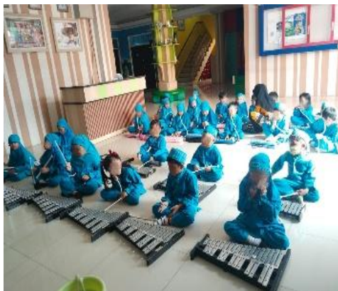
Gambar 3. Proses Evaluasi Perkembangan Kepercayaan Diri Melalui Kegiatan Ekstrakurikuler Drumband.

Gambar 3 merupakan proses evaluasi perkembangan kepercayaan diri melalui kegiatan drumband yang dilaksanakan guna mengetahui tingkat pelaksanaan kegiatan tersebut mampu menstimulasi kepercayaan diri anak usia 5–6 tahun. Evaluasi difokuskan pada perubahan perilaku anak selama dan setelah mengikuti kegiatan drumband . Dalam penelitian ini, evaluasi kepercayaan diri anak dianalisis melalui tiga indikator utama, yaitu keberanian melakukan aktivitas, kemampuan mengungkapkan perasaan, dan kemampuan bersosialisasi dengan percaya diri. Ketiga indikator tersebut digunakan sebagai dasar untuk menilai perkembangan kepercayaan diri anak secara menyeluruh.