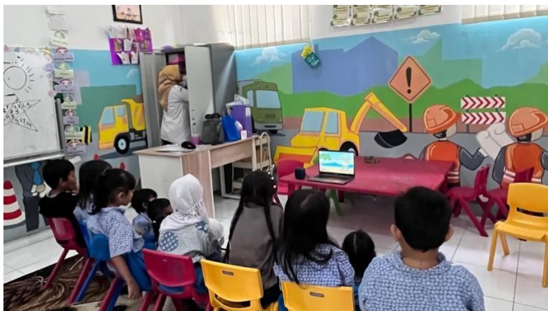
Gambar.3 Suasana Lingkungan Kelas Nyaman, Aman, dan Ramah Anak

Hasil penelitian menunjukkan bahwa guru memberikan respons yang cepat ketika muncul perilaku verbal negatif di kelas, seperti mengejek, memanggil dengan sebutan tidak pantas, atau menggunakan kata-kata kasar. Guru memberikan teguran secara langsung dengan pendekatan personal agar anak tidak merasa dipermalukan di depan teman-temannya. Dalam proses tersebut, guru memberikan pemahaman kepada anak bahwa perilaku tersebut tidak sesuai dengan norma interaksi yang baik di lingkungan sekolah. Anak kemudian diarahkan untuk menyadari kesalahannya serta diminta untuk meminta maaf kepada teman yang terdampak. Pendekatan ini menunjukkan bahwa guru tidak hanya menegur perilaku yang salah, tetapi juga menanamkan nilai tanggung jawab dan empati pada anak. Upaya pencegahan yang dilakukan guru terlihat melalui pembiasaan nilai-nilai positif dalam kegiatan pembelajaran sehari-hari. Agar tidak terjadi dampak yang berkelanjutan seperti hilangnya semangat belajar, kesulitan bersosialisasi dengan teman sebaya, hingga munculnya ketakutan untuk berpartisipasi dalam aktivitas sekolah.