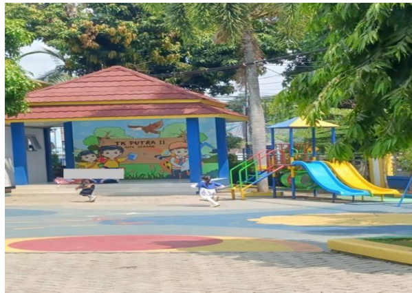
Gambar.2 Lingkungan Sekolah

mencegah bullying, kekerasan fisik-verbal, dan diskriminasi, sambil memastikan siswa merasa dilindungi serta termotivasi belajar. Ini mendukung tumbuh kembang emosional, sosial, dan intelektual, serta melibatkan partisipasi aktif siswa dalam pengambilan keputusan. Pernyataan tersebut di perkuat dalam penelitian bahwa anak usia dini berada pada tahap perkembangan yang sangat penting sehingga membutuhkan dukungan yang optimal dari lingkungan pendidikan di sekitarnya. Pendidikan karakter sejak dini melalui pembiasaan dan keteladanan berperan penting dalam membentuk nilai moral seperti empati dan tanggung jawab, sehingga mendukung terciptanya iklim Sekolah Ramah Anak yang efektif dalam mencegah perilaku harassment verbal pada anak (Pertiwi, 2023; Putri, 2022; Nurbani et al., 2024). Salah satu upaya yang dilakukan untuk mewujudkan lingkungan belajar yang aman, nyaman, serta terbebas dari berbagai bentuk kekerasan adalah melalui penerapan Program Sekolah Ramah Anak, meskipun implementasinya masih menghadapi kendala seperti rendahnya pemahaman masyarakat dan terbatasnya media edukasi interaktif (Sukadari, 2020; Widodo, 2021; Anggraini et al., 2025). Oleh karena itu, Lingkungan sekolah perlu di rancang agar benar-benar mendukung kebutuhan anak.