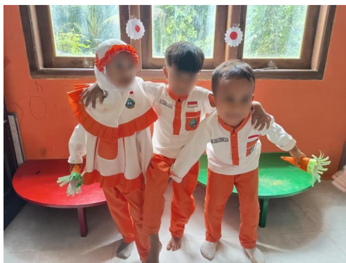
Gambar 4 Anak-Anak Menunjukkan Kekompakan Dan Kerja Sama Yang Baik Saat Bermain Permainan Tradisional Rab Kerrabhen Sape

Permainan tradisional memiliki hubungan signifikan dengan perkembangan sosial anak karena di dalamnya terkandung kesempatan untuk berkomunikasi, berinteraksi, dan bernegosiasi