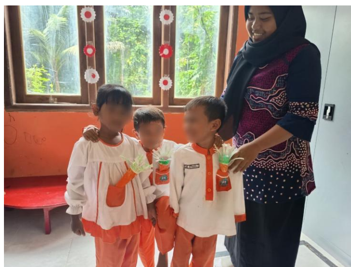
Gambar 3 Anak Mampu Menunjukkan Sikap Kerjasama Dalam Perkembangan Sosial Emosional Pada Saat Bermain Permainan Rab Kerraben Sape

Berdasarkan Gambar 2, skor pretest dan skor posttest menunjukkan peningkatan pada rata-rata skor dari pretest sebesar 3,27 menjadi 11,53 pada posttest, artinya terdapat perubahan substantif dengan selisih 8,26 poin atau sebesar 68,83 persen, Nilai t sebesar -53.935 dan signifikansi sebesar 0,001 yang berada di bawah \alpha = 0,05 , sehingga hipotesis alternatif diterima, artinya permainan tradisional Rab-Kerraben Sape berpengaruh dan signifikan terhadap perkembangan sosial-emosional anak usia 5-6 tahun. Temuan ini menegaskan bahwa permainan yang berbasis kearifan lokal Madura ini dapat meningkatkan kemampuan dan perkembangan anak dalam mengenali, mengelola emosi, berkomunikasi antar teman dengan baik, membangun relasi sosial yang sehat, serta menunjukkan perilaku kooperatif dan empatik sesuai norma perkembangan yang ditetapkan BSKAP 2025.