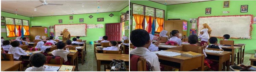
Gambar 2. Pelaksanaan Kegiatan Awal Pembelajaran

Berdasarkan Gambar 2 dapat diamati guru sebelum memulai kegiatan pembelajaran guru mengarahkan siswa untuk duduk di tempat duduknya, guru juga bukan hanya menyuruh saja tetapi guru ikut bergerak untuk merapikan tempat duduk siswa, dalam proses menciptakan suasana yang kondusif guru mengalami kendala yaitu salah satunya siswa yang sulit untuk diatur dapat kita amati digambar juga ada siswa yang berdiri diri, guru mengatasi kendala tersebut dengan cara menegur siswa tersebut agar kembali duduk di tempat duduknya, setelah tempat duduk rapi guru memberikan arahan serta semangat motivasi belajar siswa, kemudian siswa duduk dengan rapi sebagai bentuk respon terhadap arahan guru. Temuan ini mempertegas bahwasanya guru mempunyai pandangan yang baik terhadap tahap pelaksanaan kegiatan awal pembelajaran, kegiatan awal dilakukan oleh guru demi terciptanya suasana awal pembelajaran yang efektif dan kondusif.