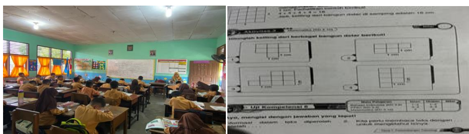
Gambar 4. Kegiatan Pelaksanaan Kegiatan Penutup

Berdasarkan hasil wawancara yang telah dilakukan dengan guru kelas rendah di SD Negeri 017 Pandau Jaya informasi pada pelaksanaan kegiatan akhir yang didapatkan guru mengatakan pada kegiatan akhir pembelajaran guru memberikan tindak lanjut yang berupa tugas mandiri yang akan dikerjakan siswa dilembar kerja siswa, berdasarkan wawancara dengan guru kelas rendah guru mengatakan pemberian tugas kepada siswa agar mengetahui seberapa paham siswa terhadap materi yang telah diberikan guru sebelum mengakhiri pembelajaran, guru juga mengatakan bahwasanya guru menyimpulkan materi yang diajarkan bersama-sama dengan siswa, serta didapatkan informasi dari hasil wawancara dengan guru kelas rendah bahwa guru mengatakan fungsi dari menyimpulkan materi di akhir pembelajaran agar siswa juga bisa mengingat kembali serta memahami materi yang dipelajari pada saat itu. Berikut gambaran pelaksanaan kegiatan penutup pembelajaran tematik dapat dilihat pada kegiatan Gambar 4.