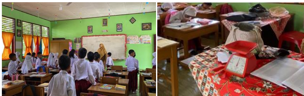
Gambar 3 . Pelaksanaan Kegiatan Inti Pelajaran

Berdasarkan hasil wawancara yang telah dilakukan dengan guru kelas rendah di SD Negeri 017 Pandau Jaya, informasi pada pelaksanaan kegiatan inti yang didapatkan guru mengatakan materi yang dipelajari pasti terkait dengan tema pembelajaran sesuai dengan RPP yang telah dirancang guru, pada saat pelaksanaan kegiatan inti guru mengatakan ada kendala yang sering dihadapi guru, berupa waktu peralihan dari mata pelajaran satu ke mata pelajaran yang lain yang begitu singkat, serta kemampuan anak dalam menangkap pembelajaran berbeda-beda menjadi kendala guru dalam tahap pelaksanaan di kegiatan inti ini, dari hasil wawancara dengan guru kelas rendah ditemukan informasi bahwasanya guru menggunakan metode pembelajaran yang sesuai dengan materi serta karakteristik siswa seperti metode ceramah serta tanya jawab, dalam hasil wawancara ditemukan juga guru mengatakan dalam proses pelaksanaan pembelajaran di kegiatan ini guru menggunakan media pembelajaran jika memang materi memungkinkan untuk disediakan media yang mudah ditemukan dan sederhana, didapatkan juga informasi dari hasil wawancara dengan guru kelas rendah bahwa guru mengatakan guru memiliki waktu dalam berinteraksi dengan siswa seperti dengan melakukan sesi tanya jawab serta kegiatan yang bisa dilakukan bersama dengan siswa. Berikut gambaran pelaksanaan kegiatan inti pembelajaran tematik dapat dilihat pada kegiatan Gambar 3