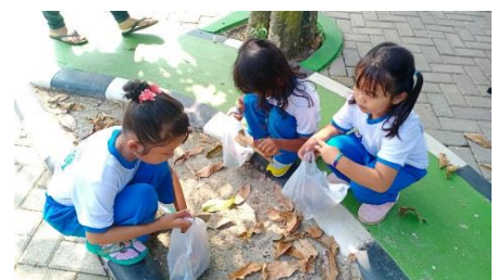
Gambar 3. Proyek Jumat Bersih