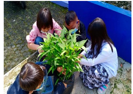
Gambar 2. Proyek Berkebun