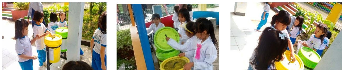
Gambar 4. Proyek Memilah Sampah Organik dan Anorganik

Bersumber pengamatan sesudah implementasi kegiatan-kegiatan proyek, anak kelompok B di TK Negeri Pembina Subang, Anak semakin tumbuh kepeduliannya terhadap lingkungan dalam menjaga dan merawat lingkungan di sekitar sekolah. Anak menjadi terbiasa untuk menjaga kebersihan kelas, halaman dan lingkungan di sekitar sekolah, membuang sampah pada tempatnya dan memilahnya sebelum memasukkan ke dalam tempat sampah sesuai jenisnya yakni sampah anorganik dan organik (Gambar 4), menjaga dan merawat tanaman yang telah ditanamnya dengan menyiram tanaman setiap hari ketika datang ke sekolah, membersihkan dari rumput-rumput liar yang bertumbuh disekeliling tanaman. Keterlaksanaan kegiatan pembelajaran dengan implementasi Project based learning juga menjadi anak lebih senang karena kegiatan pembelajaran memberikan pengalaman yang bermakna bagi pengembangan karakter peduli lingkungan dan guru juga menjadi lebih variatif dalam menyajikan program pembelajaran serta menyesuaikan dengan minat dan keinginan anak.