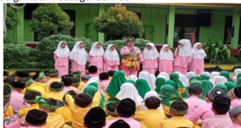
Gambar .4. Kegiatan Muhadharah