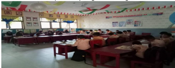
Gambar .1. Kegiatan Membaca 15 Menit Sebelum Memulai Pembelajaran

Hal ini sejalan dengan pendapat (Sari et al., 2021) budaya literasi ini selain menumbuhkan karakter gemar membaca, karakter lain yang muncul disiplin dalam membaca buku dan merawat buku agar tidak rusak. Kemudian menurut (Oktarina, 2018) Program literasi ini meningkatkan karakter siswa yang gemar membaca, dibuktikan dengan kesadaran mereka pada waktu istirahat dan waktu luang, pemanfaatan sudut baca atau perpustakaan, serta banyaknya pengunjung perpustakaan dan buku yang dipinjam secara rutin. Selain itu, dengan program pendidikan ini siswa akan memperoleh data dan pengalaman yang diperoleh dengan menggunakan. Hambatannya kadang masih ada siswa yang suka lupa untuk membawa buku dan biasanya yang begitu siswa yang kurang motivasi membacanya karena di rumah tidak dibiasakan. Hambatan ini juga ditemukan pada penelitian (Dharma, 2020) yaitu siswa tidak mengikuti intruksi dari guru untuk membawa buku dari rumah dan siswa masih ada yang bermain ketika membaca sehingga tidak fokus untuk membaca. Hal ini dapat dilihat pada gambar 1 sebagai berikut: