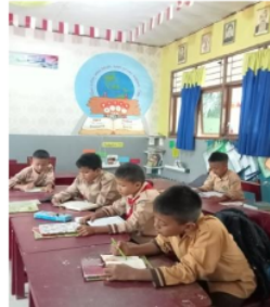
Gambar .2. Kegiatan Membaca Alquran