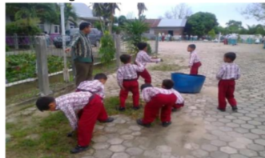
Gambar .3. Kegiatan Rabu Bersih