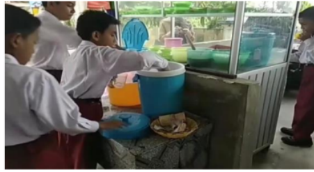
Gambar .5. Kantin Jujur

uangnya sendiri, namun tetap ada penjaga yang memperhatikannya. Kantin jujur ini sudah berjalan sejak tahun 2021. Hambatannya masih ada siswa yang ketahuan tidak jujur dan akan diberi pengarahan dan motivasi untuk bersikap jujur. Selain itu masih ada siswa yang bingung menghitung kembalian. Kantin jujur dapat dilihat pada gambar 5 sebagai berikut: