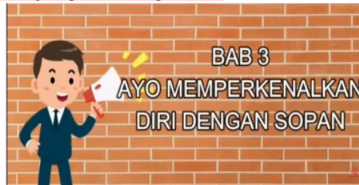
Gambar 3. Media video Pembelajaran

Kemampuan guru dalam memanfaatkan teknologi guna menyajikan materi pembelajaran terlihat dari guru sudah menggunakan teknologi yang tepat dalam menyajikan materi pembelajaran kepada siswa. Guru menggunakan media pembelajaran yang berbasis teknologi seperti penayangan video pembelajaran, penayangan lagu “Garuda Pancasila” serta penayangan PPT interaktif. Namun ada guru yang belum menggunakan media pembelajaran berbasis teknologi karena materi yang dipelajarinya dapat media pembelajaran yang berbasis papan undian. Salah satunya adalah media video pembelajaran yang dapat dilihat pada gambar 3 sebagai berikut: