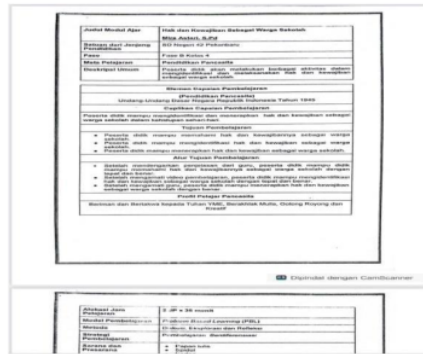
Gambar 1. Modul Ajar yang dibuat oleh guru menggunakan MS. Word

Guru menyusun modul ajar menggunakan aplikasi yang ada dikomputer yaitu Ms. Word. Guru memanfaatkan teknologi untuk memudahkan guru menyusun administrasi pembelajaran terutama adalah modul ajar yang akan digunakan guru selama proses pembelajaran. Di dalam modul ajar yang disusun guru juga, guru sudah mencantumkan semua rancangan proses pembelajaran termasuk media pembelajaran yang digunakan dan sarana prasarana yang digunakan.