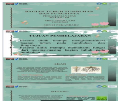
Gambar 2. Bahan ajar Bentuk powerpoint interaktif

Guru menyusun modul ajar menggunakan aplikasi yang ada dikomputer yaitu Ms. Word. Guru memanfaatkan teknologi untuk memudahkan guru menyusun administrasi pembelajaran terutama adalah modul ajar yang akan digunakan guru selama proses pembelajaran. Di dalam modul ajar yang disusun guru juga, guru sudah mencantumkan semua rancangan proses pembelajaran termasuk media pembelajaran yang digunakan dan sarana prasarana yang digunakan.