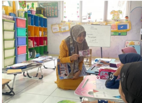
Gambar 2. Dokumentasi Penjelasan Materi Terkait Kemampuan Literasi Keuangan Melalui Kegiatan Menabung

Kemampuan literasi keuangan melalui kegiatan menabung pada anak dapat dijadikan sebagai moda pilihan, artinya guru dapat memiliki media pembelajaran yang sesuai dan efisien untuk mencapai tujuan pada pendidikan anak usia dini. Disamping itu, perkembangan dan pertumbuhan yang terlaksana secara maksimal, diperlukannya stimulasi yang disesuaikan dengan kebutuhan anak (Harahap, 2019). Orangtua diharapkan dapat memberikan dukungan serta mendampingi anak selama proses belajar untuk memastikan literasi anak berkembang dengan optimal (Bunayya & Eliza, 2021). Namun pada situasi ini anak TKIT Bina Bangsa Islamic School Kota Serang menerapkan kegiatan menabung setiap hari dengan uang coin. Disamping itu, keluarga dan sekolah perlu menjalin kerjasama dalam memiliki peran yang efektif untuk menjadi tempat menanamkan nilai-nilai literasi keuangan melalui pengenalan konsep keuangan (Saputra & Susanti, 2021).