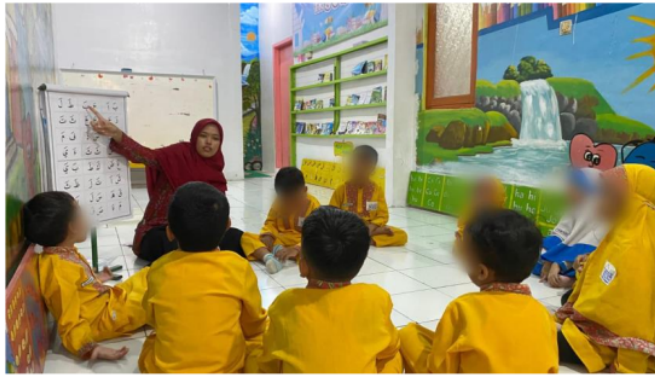
Gambar 2. Pengenalan Huruf Hijaiyah dengan Peraga Kalender

Tahap 3 pengenalan huruf dengan buku dilaksanakan pada setiap hari senin-kamis. Buku pegangan santri ini digunakan untuk mengaji sesuai halaman dan kemampuan dengan pendekatan individu (perorangan). Alokasi waktu mulai dari kedatangan anak sampai jam 9 pagi. Proses dilakukan dengan 1) guru membuat anak menjadi beberapa kelompok. 2) Adanya modifikasi proses di TK Bona dengan anak akan di dahulukan mengaji, setelah itu baru diperbolehkan mengikuti kegiatan lain, seperti menulis hijaiyah. 3) Guru memanggil anak sesuai urutan duduk dan diajar secara individual dengan nada rost.