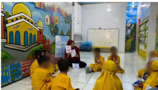
Gambar 1. Pengenalan Huruf Hijaiyah dengan Kartu Huruf

Setelah anak masuk kelas guru akan melakukan pengkondisian. Kesiapan diawali memimpin do'a kemudian kalimat Isti'adzah dan dilanjutkan dengan surat Al-Fatihah dengan alokasi waktu 5 menit. Adapun pelaksanaan dibagi menjadi beberapa tahap: Tahap 1 pengenalan dengan kartu huruf mulai dari huruf Alif (ا) sampai huruf Ra' (ر). Proses dengan kartu dilakukan selama 5 menit. Guru mengenalkan huruf hijaiyah dengan urutan sebagai berikut: 1. Guru memberikan penjelasan kepada anak sambil mencontohkan pembacaan huruf hijaiyah. 2. Untuk memperkuat pemahaman huruf hijaiyah yang sudah diajarkan, guru mengajukan pertanyaan kepada anak. Selanjutnya, guru mengajarkan konsep posisi dan arah dengan cara berikut: 1. Guru mengucapkan "ini bunyinya A (ا)," sambil menggerakkan kartu ke depan, kanan dan kiri, kemudian anak menjawab dengan menyebut huruf A (ا), 2. Guru menggerakkan tangan ke kanan sambil menyebut "satu dikanan A (ا)," dan anak menjawab dengan menyebut huruf A (ا), begitu huruf akhir yang ingin diajarkan.