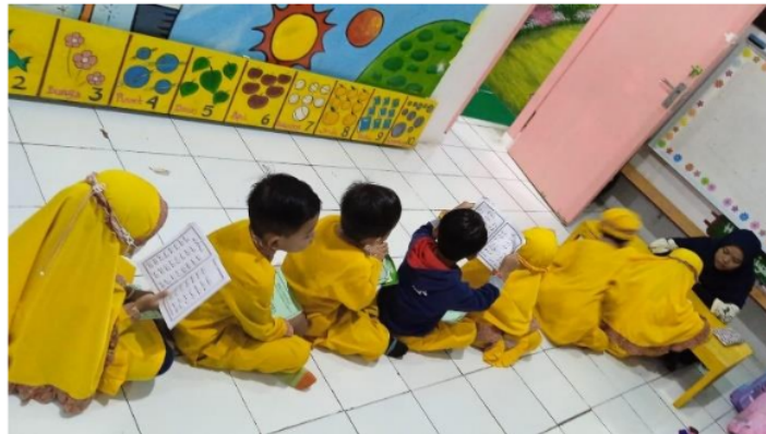
Gambar 3. Pembelajaran dengan Buku Prestasi

Tahap 3 pengenalan huruf dengan buku dilaksanakan pada setiap hari senin-kamis. Buku pegangan santri ini digunakan untuk mengaji sesuai halaman dan kemampuan dengan pendekatan individu (perorangan). Alokasi waktu mulai dari kedatangan anak sampai jam 9 pagi. Proses dilakukan dengan 1) guru membuat anak menjadi beberapa kelompok. 2) Adanya modifikasi proses di TK Bona dengan anak akan di dahulukan mengaji, setelah itu baru diperbolehkan mengikuti kegiatan lain, seperti menulis hijaiyah. 3) Guru memanggil anak sesuai urutan duduk dan diajar secara individual dengan nada rost.