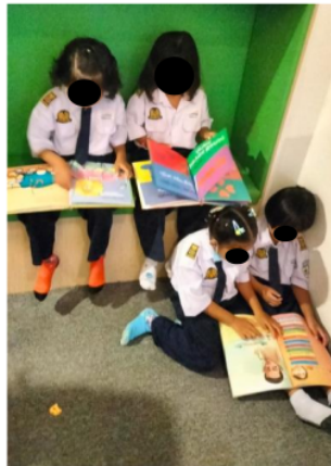
Gambar 1. Kunjungan ke perpustakaan daerah

Kegiatan ini memberikan kesempatan kepada anak untuk mengembangkan keterampilan literasi, penelitian, dan pemecahan masalah sambil mengeksplorasi sumber daya yang tersedia di perpustakaan. Selain itu, kegiatan ini juga dapat meningkatkan minat membaca dan mengapresiasi nilai-nilai budaya dan intelektual lokal yang terkandung dalam koleksi perpustakaan. Nur Fauziah (2015) berpendapat bahwa guru mempunyai peran penting dalam mengadaptasi metode pengajaran yang kreatif dan menarik seperti bercerita interaktif, permainan kata atau drama, yang tidak hanya menghibur tetapi juga merangsang imajinasi dan minat membaca siswa. Sebuah penelitian yang dilakukan oleh Smith et al. (2020) menemukan bahwa membawa anak-anak ke perpustakaan daerah secara teratur sebagai bagian dari kegiatan ko-kurikuler dapat meningkatkan minat mereka dalam membaca dan meningkatkan kemampuan literasi mereka secara keseluruhan. Hasil penelitian ini menunjukkan bahwa perpustakaan daerah tidak hanya menjadi tempat membaca, tetapi juga tempat yang mendorong pengembangan kemampuan sosial, kritis, dan analitis anak.