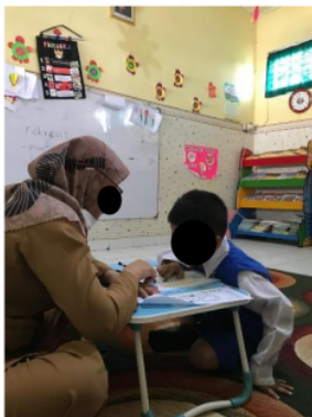
Gambar 2. Membaca bersama guru

Tempat yang dirancang khusus untuk membaca bisa menjadi tempat yang menyenangkan bagi anak. Tempat yang tenang dan nyaman membantu anak-anak untuk lebih fokus saat membaca, karena tidak ada gangguan atau kebisingan yang mengganggu perhatian anak. Dengan menyediakan tempat yang nyaman dan tenang untuk membaca bersama, tidak hanya membantu meningkatkan keterampilan membaca anak, tetapi juga menciptakan pengalaman yang menyenangkan dan berharga bagi anak dalam menjelajahi dunia buku dan pengetahuan. Sebuah penelitian oleh Morrow (2003) menunjukkan bahwa menyediakan sudut baca yang kaya dengan buku-buku yang beragam dan menarik di TK dapat membantu meningkatkan keterampilan literasi awal anak-anak. Penelitian oleh Smith dan Jones (2019) menemukan bahwa anak-anak yang memiliki akses ke ruang baca yang nyaman dan dilengkapi dengan permainan edukatif menunjukkan peningkatan yang signifikan dalam kecintaan mereka terhadap membaca dan pembelajaran.