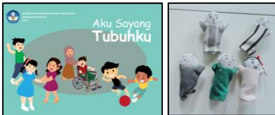
Gambar 2. Buku Cerita dan Boneka Jari

Pendidikan seksual dalam multimodal literasi selanjutnya dalam penelitian ini berupa objek fisik seperti boneka laki-laki dan perempuan, poster dan buku cerita. Penggunaan objek fisik atau media di TK ABA Mardi Putra meliputi boneka jari dan buku cerita tentang pendidikan seksual. Sebagaimana gambar 2 boneka jari dan buku cerita berjudul “Aku Sayang Tubuhku” yang digunakan sebagai objek fisik dalam multimodal literasi.