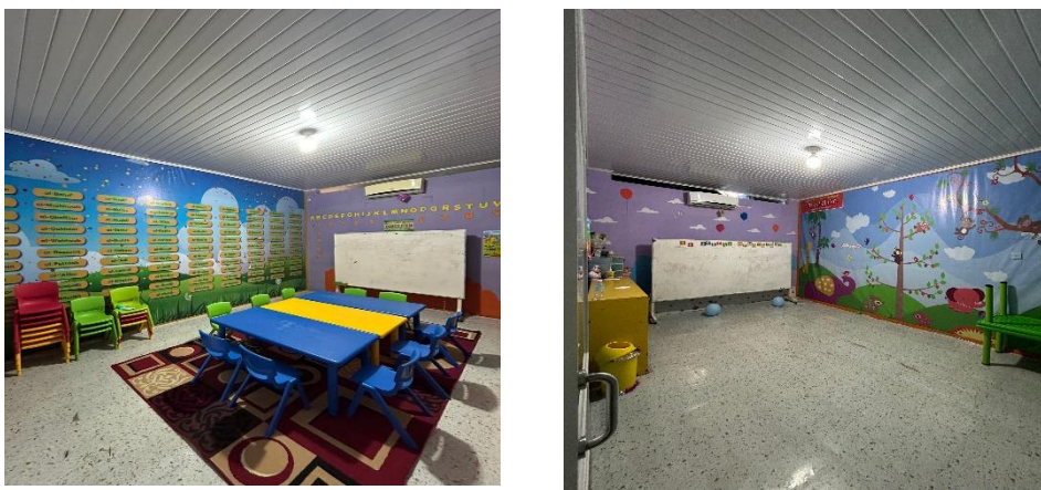
Gambar 3. Ruang Kelas A (kiri) dan Ruang Kelas B (kanan)

Setiap periodenya, pihak sekolah mengadakan rapat kerja dengan guru-guru untuk membahas kebutuhan sarana dan prasarana di kelas masing-masing. Dalam rapat ini, guru-guru menyampaikan kebutuhan spesifik mereka, seperti alat bermain, buku, atau peralatan lain yang mendukung proses pembelajaran. Semua kebutuhan yang diidentifikasi dicatat oleh manajemen untuk ditindaklanjuti. Setelah sarana dan prasarana disediakan, sekolah melakukan review berkala untuk memastikan bahwa fasilitas yang ada masih dalam kondisi baik dan memenuhi kebutuhan. Jika ditemukan kekurangan atau kebutuhan tambahan, manajemen segera menindaklanjuti dengan menyediakan apa yang diperlukan. Misalnya, jika alat pembelajaran atau alat bermain kurang, manajemen akan mengadakan tambahan tersebut. Sarana dan prasarana yang memadai sangat penting sebagai penunjang kesuksesan proses pembelajaran. Fasilitas yang baik memungkinkan guru untuk mengajar dengan lebih efektif dan siswa untuk belajar dengan lebih nyaman. Hal ini mencakup tidak hanya alat-alat belajar dasar seperti kursi dan meja, tetapi juga fasilitas tambahan seperti alat bermain, buku, dan media pembelajaran lainnya (Gambar 3). Dengan dukungan fasilitas yang memadai, proses pembelajaran menjadi lebih bermutu dan tujuan pendidikan dapat tercapai dengan lebih baik.