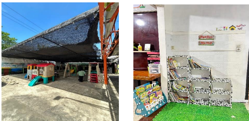
Gambar 4. Wahana bermain (Kiri) dan Pojok Baca (Kanan)

dan media lain di dalam kelas memastikan bahwa siswa memiliki lingkungan belajar yang nyaman dan mendukung. Selain itu, adanya taman bermain, wahana bermain (Gambar 4), kolam renang menunjukkan perhatian sekolah terhadap kegiatan fisik dan rekreasi siswa, yang penting untuk keseimbangan antara aktivitas akademis dan non-akademis.