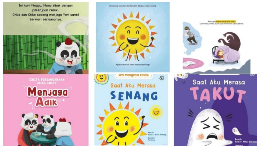
Gambar 1. Beberapa Buku di Google Playbook