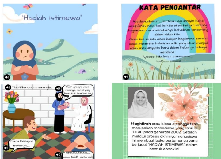
Gambar 3. E-book Setelah Revisi

Pengembangan yang dilakukan setelah tahapan revisi yaitu: 1) judul cerita yang awalnya “kisah caca dan adik: menyambut hadiah terindah” menjadi “Hadiah Istimewa”, 2) kata pengantar kata “HELLO” diubah menjadi “Assalamualaikum”, 3) percakapan di dalam buku cerita ditambahkan gelembung percakapan, 4) diakhir buku cerita penambahan profil penulis cerita, 5) buku cerita sebelum revisi tidak terdapat fitur suara, dan setelah revisi terdapat fitur suara dari cover sampai dengan selesai.