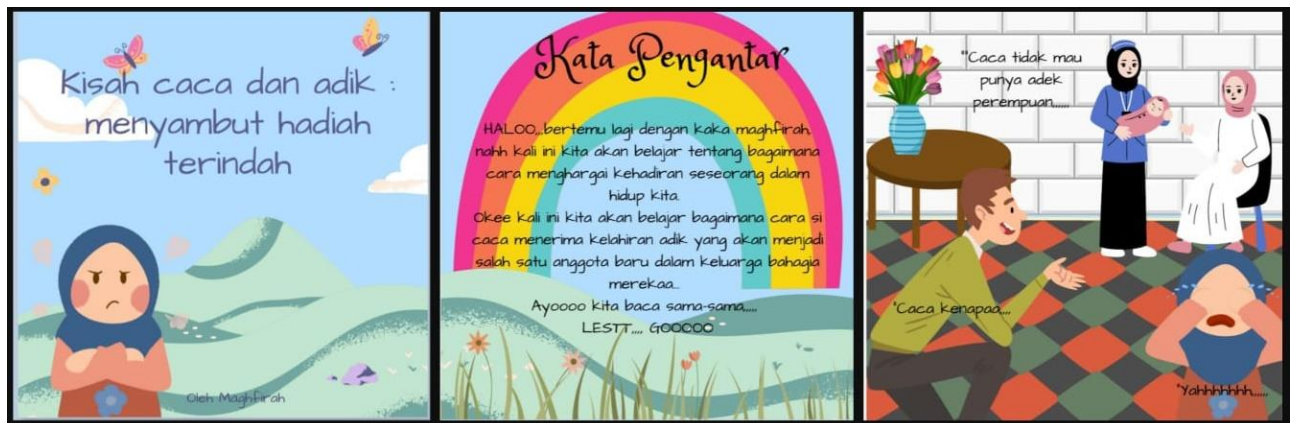
Gambar 2. E-book Sebelum Revisi

Pada tahap ini dilakukan proses pengembangan e-book “Hadiah Istimewa”, pengembangan instrumen kelayakan uji ahli media dan uji ahli materi, pada tahap ini e-book masih memerlukan perbaikan setelah diuji kelayakan oleh ahli media dan ahli materi. Dari tahap pengembangan terdapat beberapa masukan dari ahli validasi materi dan ahli validasi media. Berdasarkan dari uji validasi tersebut terdapat beberapa masukan berupa: 1) Sebaiknya dimulai dengan memberi salam (yang pertamanya menggunakan kata HELLO diubah menjadi ASSALAMUALAIKUM ), 2) Tulisan lest go nya keliru, yang benar “ let’s go karena kata dasarnya let us go ”, 3) Di petunjuk dan indikatornya, point 5 dan 6 sama, 4) Dalam e-book nya bentuk validasi emosi caca belum terlihat (misalnya penegasan terkait emosi marah, kesal, kecewa, sedih, atau lain-lain) 5) Sebaiknya memasukkan suara sesuai dengan karakter (di tahap awal peneliti memasukkan suara di semua karakter di dalam buku cerita dengan menggunakan satu suara saja, dan melakukan perubahan dengan mengisi suara abi dengan suara laki-laki, suara caca dengan menggunakan suara peneliti, dan suara suster dan ama diisi oleh suara perempuan. Pada awal penulisan e-book “Hadiah Istimewa” ini berlangsung selama satu minggu, tahap pengembangan diawali dengan membuat cover cerita sampai biodata penulis menggunakan aplikasi canva.com . Hasil pengembangan e-book “Hadiah Istimewa” dapat dilihat pada Gambar 2 dan Gambar 3.