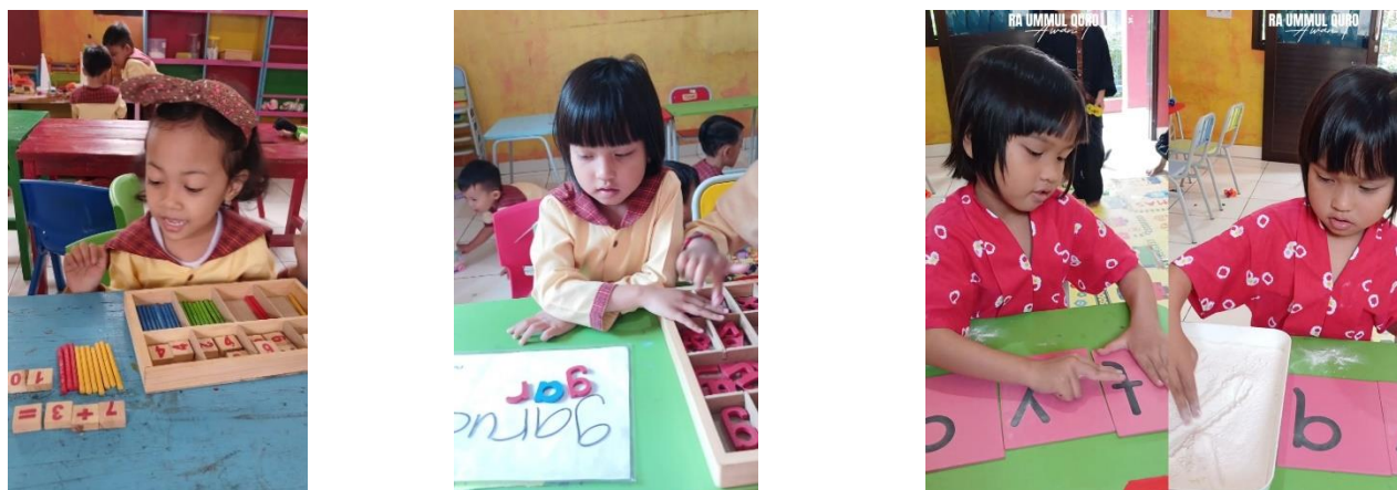
Gambar 2. Pengenalan Huruf di Sekolah

Dalam pembelajaran calistung di RA UQ, anak diperkenalkan huruf melalui kata-kata dengan menggunakan berbagai material seperti Large Moveable Alphabet , Sand Paper Letter , Sand Paper Number , dan lain sebagainya. Sand Paper Letter adalah kartu-kartu yang dibuat dari kayu dan setiap hurufnya memiliki tekstur yang kasar. Montessori membuat berbagai macam kartu huruf dari papan kayu dan setiap huruf dicetak (Darnis, S. 2018) (Gambar 2).