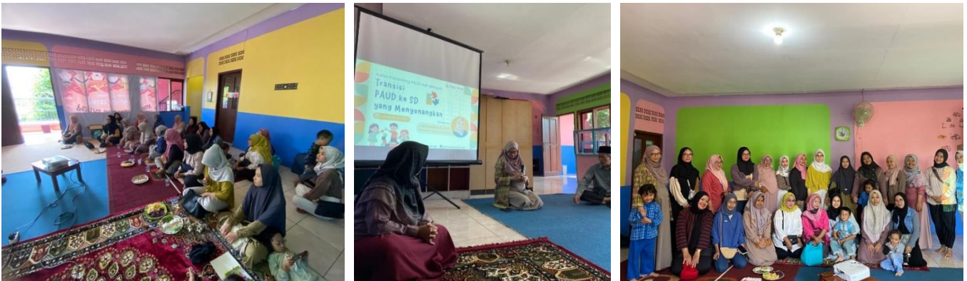
Gambar 3. Kegiatan Seminar Parenting Transisi PAUD ke SD yang Menyenangkan di RA UQ Yang Dilaksanakan Pada Tanggal 15 Desember 2023

Secara umum tujuan program parenting adalah untuk memberikan pengetahuan dan keterampilan orangtua mengenai pendidikan bagi anak usia dini dan mengajak orang tua untuk bersama-sama memberikan pendidikan yang terbaik bagi anak. Program parenting ini juga bertujuan untuk meningkatkan kerjasama antara orang tua dan sekolah dalam hal pendidikan anak dan meningkatkan kompetensi guru. Pelaksanaan program parenting ini sejalan dengan apa yang tercantum dalam UU Nomor 2 Tahun 1989 tentang sistem pendidikan nasional, bahwa pendidikan keluarga merupakan bagian dari jalur pendidikan luar sekolah yang diselenggarakan dalam keluarga dan yang memberikan keyakinan agama, nilai budaya, nilai moral dan keterampilan (Munawar, M., & Karmila, M. (2019) (Gambar 3).