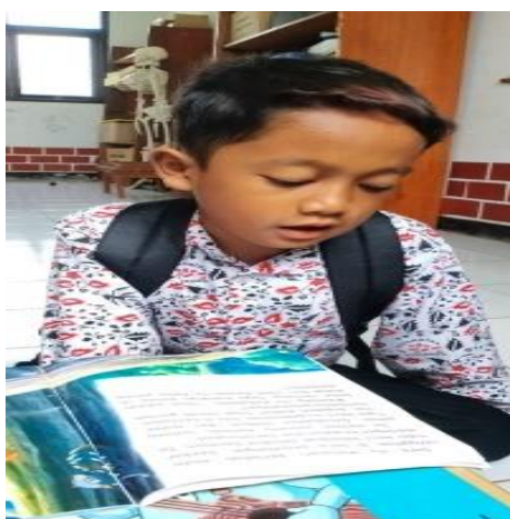
Gambar 3. Membaca Menggunakan Buku Cerita Bergambar

Penelitian yang dilakukan oleh Mindaudah dan Ningrum, (2023) menunjukkan bahwa penggunaan buku cerita bergambar dapat meningkatkan kemampuan membaca siswa. Adapun hasil penelitiannya pada pra siklus rata-rata nilai kelas 64,29 dengan 9 siswa sudah mencapai KKM dan 15 siswa masih dibawah KKM. Setelah dilakukan treatment , pada siklus 1 mengalami kenaikan sebesar 68,12 dengan 9 siswa di atas KKM. Siklus 2 nilai rata-rata kelas meningkat menjadi 79,16 dengan 21 siswa sudah mencapai nilai KKM. Penelitian lain yang dilakukan oleh Ali dan Asrial, (2022) dengan judul “Peningkatan Kemampuan Membaca Peserta Didik Kelas II SDN 136/I Semangkat melalui Buku Cerita Bergambar” menunjukkan bahwa peneliti melakukan treatment pada siswa kelas II dengan 2 siklus dimana pada siklus I, nilai rata-rata belum memenuhi keberhasilan penelitian tetapi dalam siklus II dengan adanya perbaikan dari siklus I, nilai rata-rata menunjukkan peningkatan dari 64% menjadi 80%.