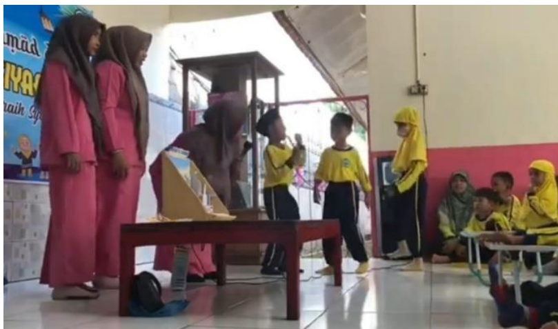
Gambar 2. Anak Tampak Sangat Antusias Ketika Berkesempatan Maju Kedeapan